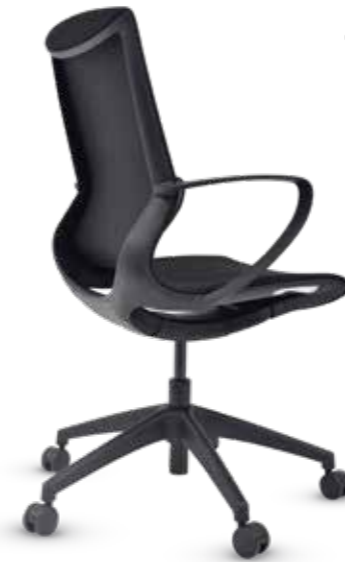
02102PR10AMGN Silla operativa Malla negra, estructura negra

“ Modelos autoajustables al movimiento del usuario ”