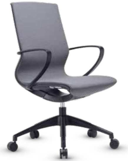
02102PR10AMGG Silla operativa Malla gris, estructura negra

“ Modelos autoajustables al movimiento del usuario ”