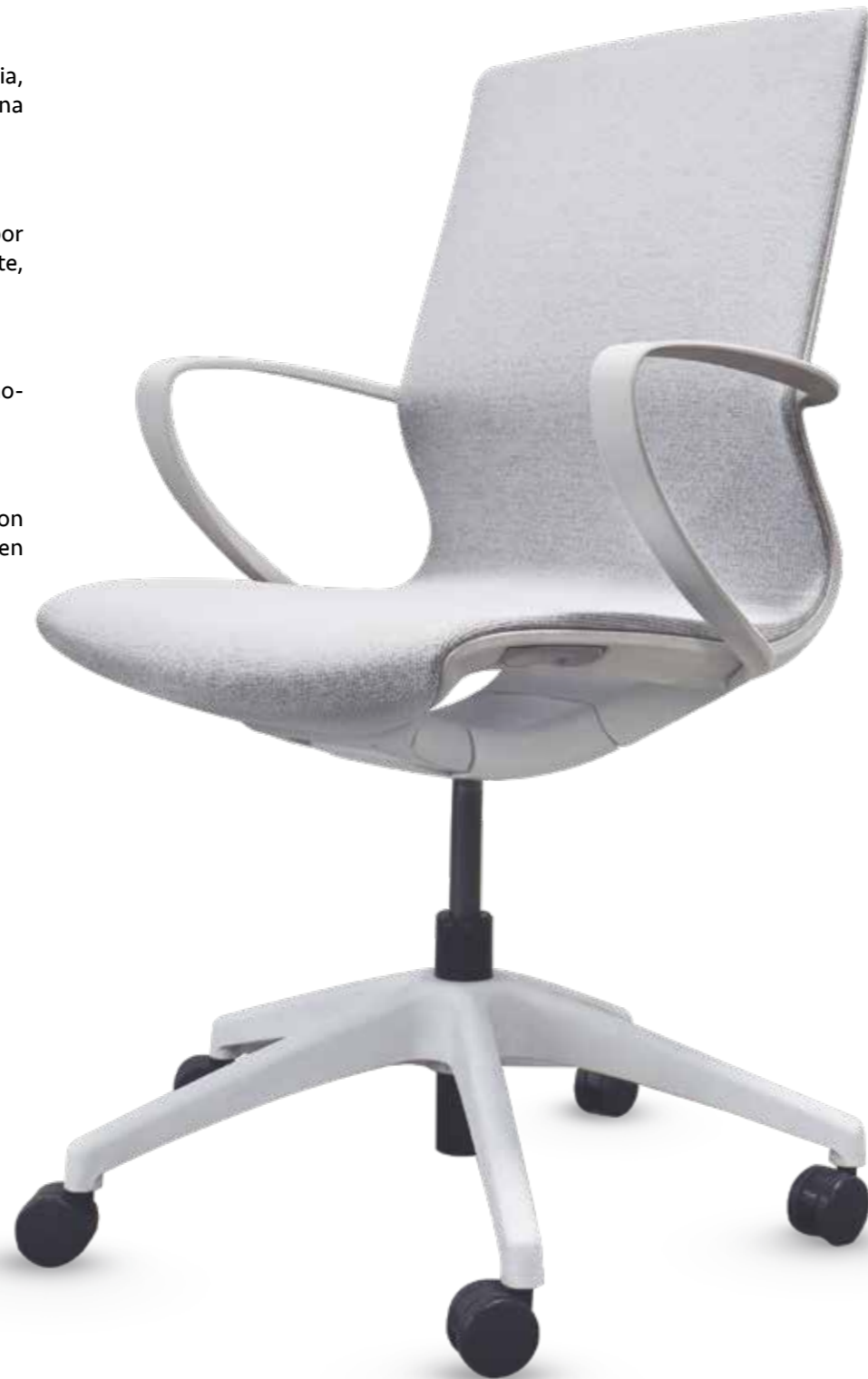
02102PR10AMGB Silla operativa Malla blanca, estructura blanca

De cinco puntos con rodajas de nylon con facilidad de desplazamiento en cualquier tipo de piso.