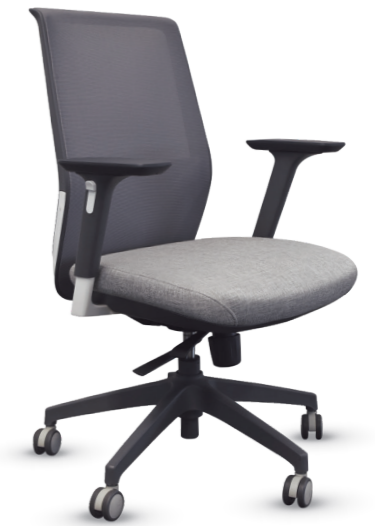
02102PY13ATGG Silla ejecutiva

“Opciones de tapizado del asiento en piel ecológica, tactopiel y tela”