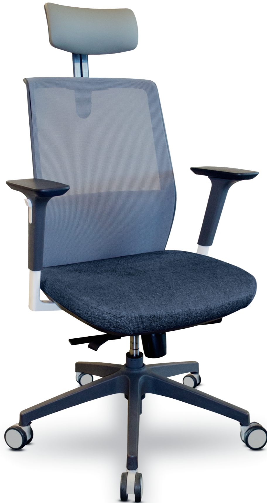
02102PY13XTGG Silla ejecutiva

De cinco puntos de 27" de diámetro con rodajas de nylon bicolor con facilidad de desplazamiento en cualquier tipo de piso.