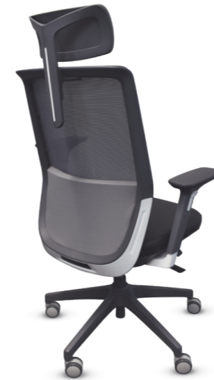
02102PY13XTGG Silla ejecutiva con cabecera

“Opciones de tapizado del asiento en piel ecológica, tactopiel y tela”